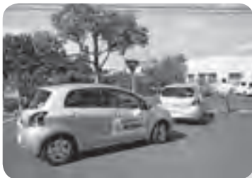
燃費計をつけて市内コースを運転

地球にも財布にもやさしいエコドライブを心掛けて…一人一人の取り組みが大きな力となります。