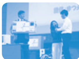
スタンプラリー抽選会