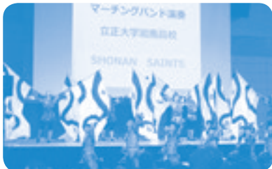
浜南高校マーチングバンド演奏