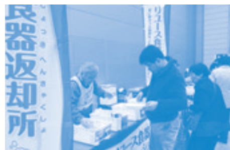
リユース食器回収のようす