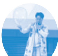
マジシャンによる化学マジックショー