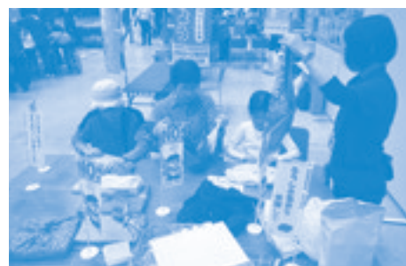
風呂敷の包み方教室