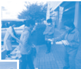
エコドライブ 啓発活動

エコドライブ啓発活動 とエコドライブ模擬 運転体験（イオン松江 ショッピングセンター）