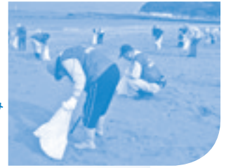
海岸の漂着ごみ 清掃活動