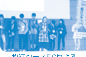
松江シティFCによるスポーツ清掃大会

オープニングセレモニーに続いて、地球温暖化に伴う「環境異変と災害」を演題として、気象台、自衛隊の講師をお招きして、度重なる異常気象と災害復旧の実態について、講演をいただきました。このほか、宍道湖水環境改善協議会の「宍道湖の水質、大量発生する藻の状況について」の発表、立正大学浜南高校によるマーチングバンド演奏、マジシャンによる化学マジックショーなどで、フェスティバルを盛り上げました。世代を繋ぐ活動として、島根大学附属中学校の学生による環境問題の総合学習の発表を行いました。また、まつえ環境市民会議主催の環境関連商品が当たる抽選会もあり、大勢の来場者が楽しいひと時を過ごし、環境に対する関心を深めていました。