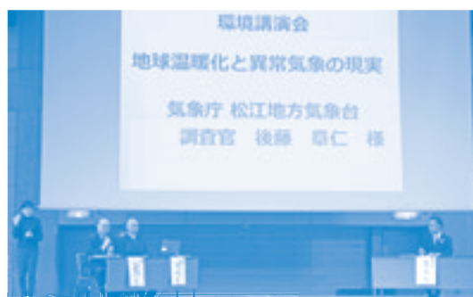
環境講演会（環境異変と災害）

猛暑が続き、熱中症の危険性、集中豪雨による河川の氾濫など、災害が相次いで発生する異常気象の現状や、災害復旧の状況について、日頃聞けない話を聞いたり映像を見て、多くの来場者とともに関心を深めることができ、環境保護の大切さを学びました。