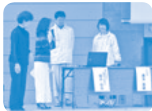
宍道湖水環境改善協議会による講演会