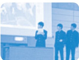
島大附属中学校の学習発表