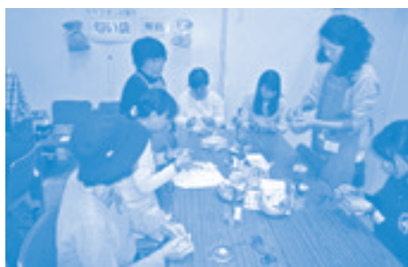
リサイクル体験教室