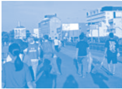
水郷祭翌朝の清掃活動