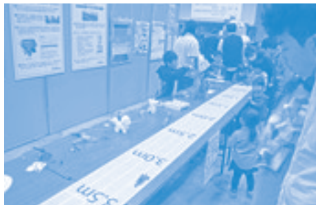
いろいろなエネルギー