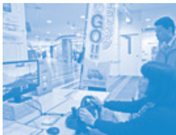
シュミレーターで 模擬運転体験を 行いました