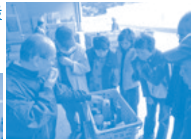
西持田リサイクルプラザ （リサイクル処理施設）