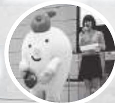
スタンプラリー抽選会