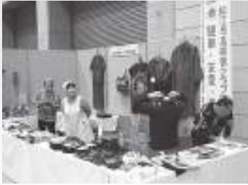
古布、古着のリフォーム作品紹介