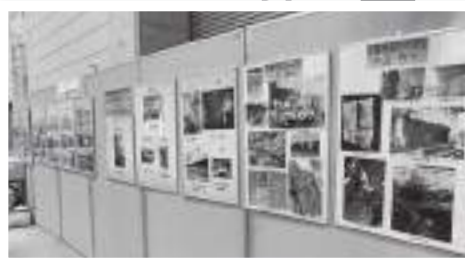
環境フェスティバルで紹介

温暖化防止活動の一環としてグリーンのカートン活動普及のため、「グリーンのカートン写真コンテスト」を行いました。96点の応募があり優秀作品は、表彰状と記念品を贈呈し、松江市環境フェスティバルの会場で展示をしました。その後、イオン松江ショッピングセンター1階の吹き抜け広場に展示しています。