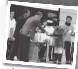
優秀チームの表彰

松江シティスポーツクラブによる、市内のごみを拾って、その量を競い合う「スポーツ清掃大会 in まつえ」が昨年が続いて環境フェスティバルのイベントとして開催され、17チーム66名が参加。応援に松江シティフットボールクラブの本多選手をはじめ5名が駆けつけて激励しました。参加者は、元気よく街に飛び出して、競いあいながらスポーツ感覚で楽しく清掃活動を行いました。