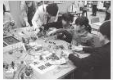
木の実や枝でおもちゃ作り