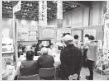
グリーン製品コーナー