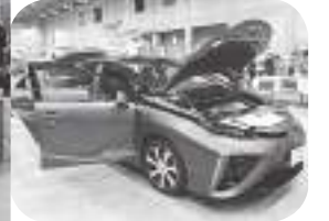
ガス展に登場した燃料電池自動車（ミライ）