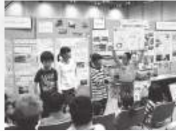
湖沼の生き物と水質学習