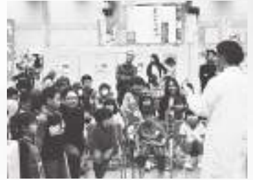
科学実験講演に聞き入る小学生