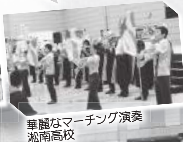
華麗なマーチング演奏 淞南高校