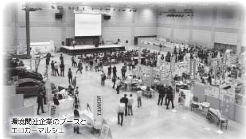
環境関連企業のブースと エコカーマルシェ

環境に関心の高い市民、NPO、事業者、行政、教育関係、報道関係者などに参加していただき、楽しみながら学べる場を提供することができました。また、昨年に引き続き山陰中央新報社主催のエコCARマルシェや松江市ガス展が同時開催となったため、約9千人を超えるグループや家族連れなどの来場者で賑いました。