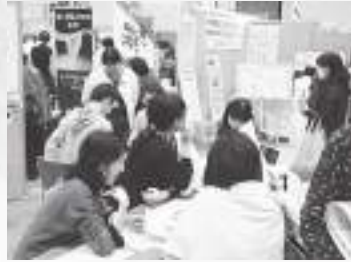
自然環境（省エネ）学習