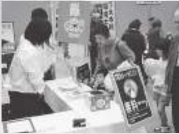
自然エネルギーと太陽光発電の紹介

どのブースも大勢の来場者で賑い、出展者の創意工夫で、見て、ふれて、体験をして、楽しみながら環境に対する知識や認識を幅広く深めることができました。