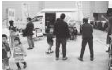
サンちゃん号、来場者の写真を入れた記念の環境新聞をつくりました