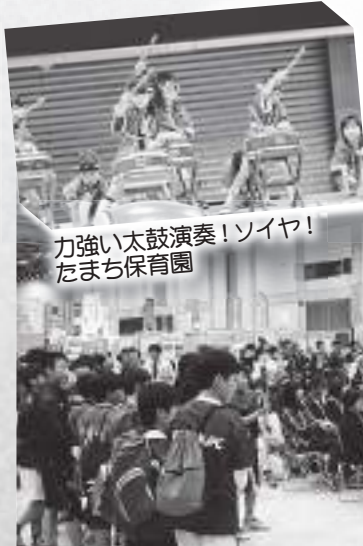
力強い太鼓演奏！ソイヤ！ たまち保育園

立正大学淞南高校の華麗なマーチングバンド演奏、たまち保育園の園児によるたまち太鼓(和太鼓演奏)を披露。民放3社のテレビ局による地球温暖化をテーマとしたステージパフォーマンスを行いました。また、まつえ環境市民会議主催の環境関連商品が当たる抽選会もあり、大勢の来場者が環境に対する関心を深めながら、楽しいひと時を過ごすことが出来ました。