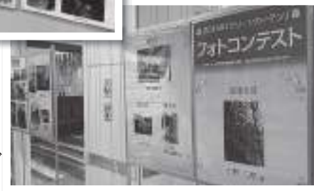
イオン松江ショッピングセンターに展示