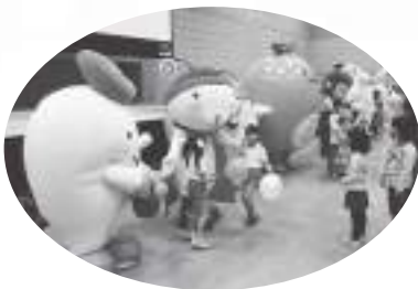
ゆるキャラ撮影会