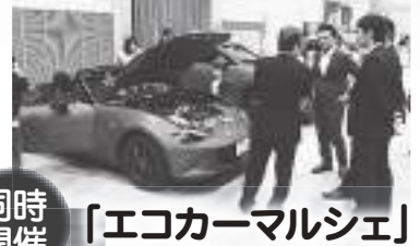
「エコカーマルシェ」