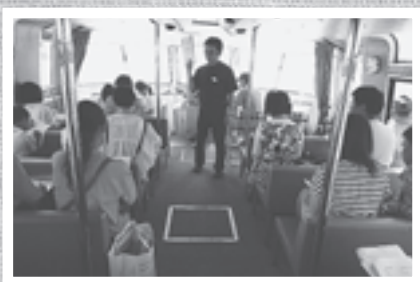
はくちょう号の中で 中海の環境学習