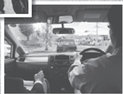
プロによるエコドライブ路上教習