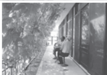
団体の部 城西公民館さん