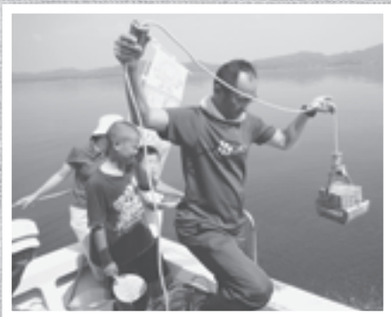
採泥器で宍道湖湖底の泥を採取