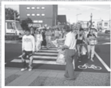
水郷祭において ごみ袋を配布する会員