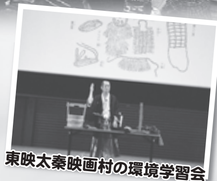
東映太秦映画村の環境学習会