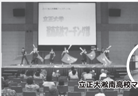
立正大浜南高校マーチング部演奏

松江開府400年祭の最後の年であり、環境フェスティバルもこれにちなんだテーマで開催しました。当日は、立正大浜南高校マーチングバンド、松江市立女子高校日本文化部(茶道)の皆さんの協力などもあり、大盛況で終わることができました。