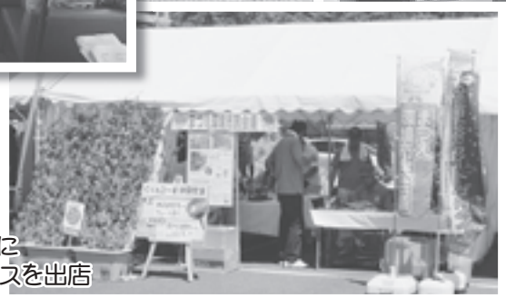
水郷祭テント村に 市民会議のブースを出店