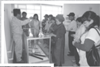
エコクリーン松江 見学会・講習会