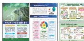
当会作成の環境保全啓発資料