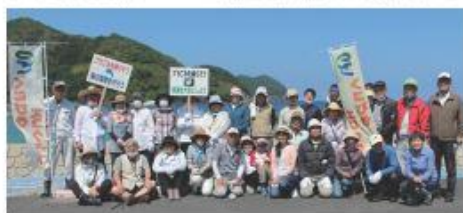
くにびきエコクラブ主催の海岸清掃に参加した市民ボランティア