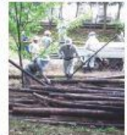
(その3) 里山保全の竹林整備