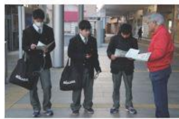
「資源を大切に」と訴える啓発活動を毎年3月、松江駅前等で実施