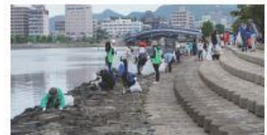
他団体主催の共同活動にも積極参加。(その1) 宍道海岸一斉清掃