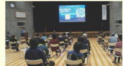
地域住民が集う公民館での劇上演とエコ講座