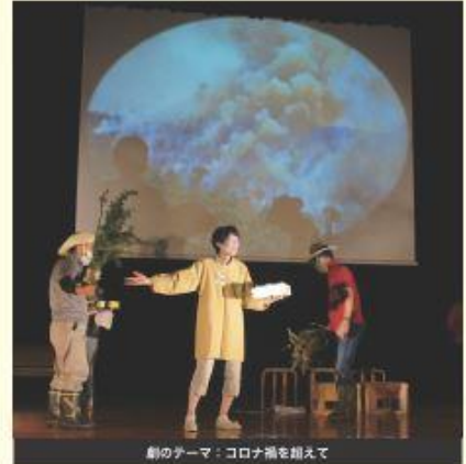
劇のテーマ：コロナ禍を越えて