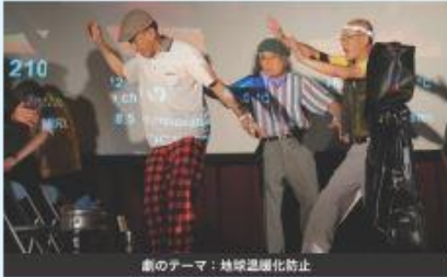
劇のテーマ：地球温暖化防止