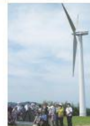
環境施設を見学。(左) 風力発電所、(右) 資源リサイクル施設