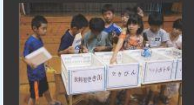
劇鑑賞後のエコ講座で、ごみの分別をやってみる