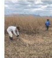
(その2) 宍道湖西岸ヨシ刈り