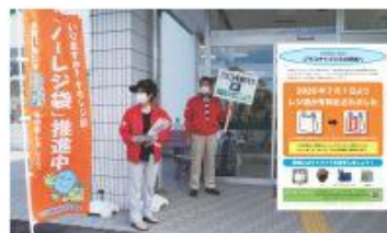
スーパー前で「ノーレジ袋でプラスチックごみ減らし」を呼びかける