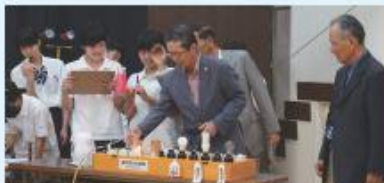
消費電力量とCO2排出量を算出し、節電の大切さを学ぶ中学生たち