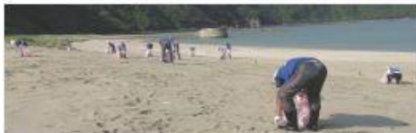
海岸の漂着ごみ回収活動