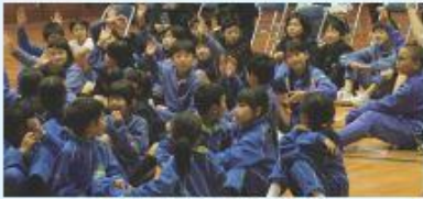
元気にエコクイズに答える小学生たち