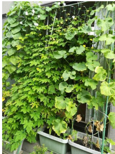
グリーンカーテン